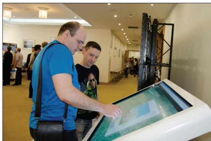
Работавшая на протяжении всего мероприятия демонстрационная зона собрала множество уникальных инновационных решений от ведущих компаний