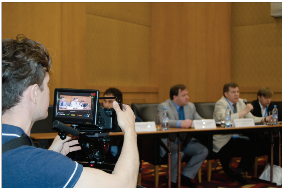
Пленарная часть конференции