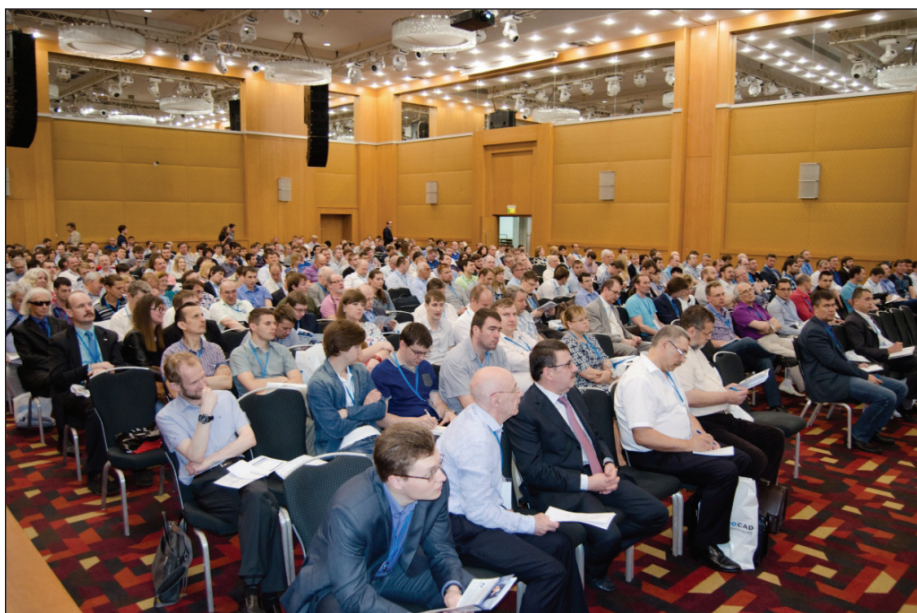
В этом году конференция собрала рекордное количество участников

Конференция стартовала с пленарной части, которая в этом году охватывала стратегически важные аспекты импортозамещения в области промышленного проектирования и, в частности, имела целью ответить на один из главных вопросов: можно ли сегодня российские разработки в области промышленного проектирования считать базовыми инструментами проектирования? Учитывая актуальность темы развития российского программного обеспечения, пленарная часть получила весомую поддержку от представителей органов государственной власти – в частности, почетными гостями конференции стали представитель Минкомсвязи РФ и спикер из Министерства строительства РФ. В своем вступительном слове генеральный директор компании "Нанософт" Максим Егоров, помимо традиционной благодарности партнерам, спикерам и участникам конференции, особо от-