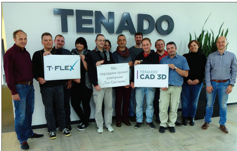
Команда TENADO объявила о сотрудничестве с компанией "Топ Системы"

Выбор в качестве партнера компании "Топ Системы" понятен. Система T-FLEX CAD — одно из наиболее интересных и прогрессивных решений на рынке САПР. Но главное — это не только профессиональный инструмент 3D-проектирования, развитые средства формирования чертежей и выходной конструкторской документации, но еще и мощные средства параметризации. Найти на рынке систему проектирования, где одни размерные параметры модели можно увязать с другими, возможно. С ограничениями, конечно, но это уже непринципиально. А вот чтобы система могла выстроить зависимость каких-либо геометрических параметров модели от потребительских свойств или характеристик будущего изделия — уже совсем другой вопрос. T-FLEX CAD это легко позволяет. Без программирования и разных ухищрений. Прямо на уровне базовой функциональности. Неудивительно, что разработчики из Германии сразу же обратили внимание на столь мощные возможности развития и специализации системы: ведь гибкость и эффективность — важнейшие качества для современного высококонкурентного рынка. Специалисты компании TENADO уверенно заявляют, что рас-