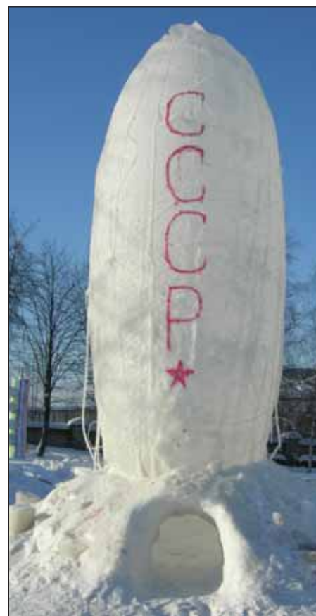
"Гравицапа" Архитектурная мастерская А. Асадова

Хотя прогнозы синоптиков так и не оправдались и в конце февраля снега в