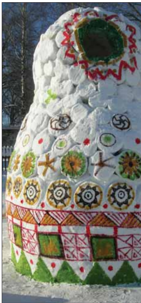
"Батрешка" Архитектурная мастерская Т. Башкаева

километры, но и века. Чудный тихий городок с печными трубами, белым снегом под слоем копти от дыма... Но самое главное: его — снега — было достаточно.